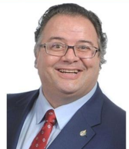
Ramez Ayoub Député de Thérèse-De Blainville