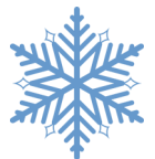
TABLE DE RÉFLEXION ET D'ACTIONS DE RETRAITÉS ET D'AÎNÉS MRC de La Rivière-du-Nord