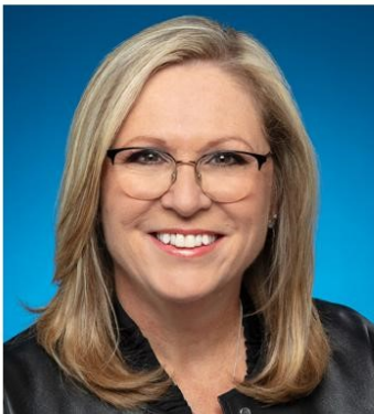
FRANCINE CHARBONNEAU Députée de Mille-Îles