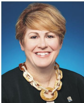
MONIQUE SAUVÉ Députée de Fabre