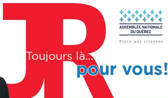
Jean Rousselle Député de Vimont

Porte-parole de l'opposition officielle en matière de Sécurité publique Porte-parole de l'opposition officielle en matière d'Agriculture