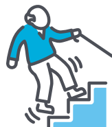
L'aménagement des espaces publics