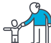
Les enjeux sociaux

Vous trouverez dans les prochaines pages des recommandations en lien avec chacun des thèmes. Nous encourageons les membres de l'AQDR à partager les recommandations qui les touchent le plus auprès de leurs instances municipales. Nous laissons aussi une grande place à nos membres afin que ceux-ci adaptent les recommandations à leur réalité.