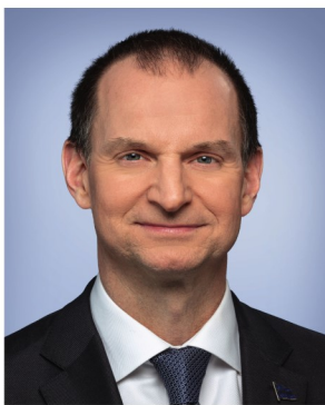
Eric Girard Député de Groulx Ministre des Finances Ministre responsable des Relations avec les Québécois d'expression anglaise