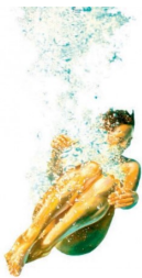
Ewald Arenz L'été où tout a commencé

Ce récit est empreint de chaleur et de nostalgie. Il suit l'amitié inattendue entre Sally, une jeune femme en quête de liberté, et Liss, une femme plus âgée, confrontée à ses propres défis. Leur lien se développe dans un cadre estival enchanteur, mêlant découvertes, confidences et moments de partage.