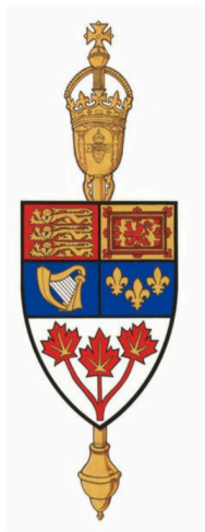
Linda Lapointe, Députée Rivière-des-Mille-Îles