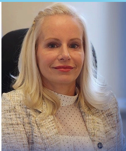
VALÉRIE SCHMALTZ DÉPUTÉE DE VIMONT À L'ASSEMBLÉE NATIONALE

Une trousse pour une alimentation saine, Le goût de vieillir en santé de La Table des Chefs, sera aussi remise aux participants. L'inscription est obligatoire avant le 5 juin 2026 et tous sont les bienvenus à l'assemblée. Les documents liés à l'AGA, dont l'avis de convocation, sont disponibles sur notre site web . Pour réserver votre place, contactez-nous au 450-978-0807 ou écrivez-nous à aqdr.laval@aqdr.org .